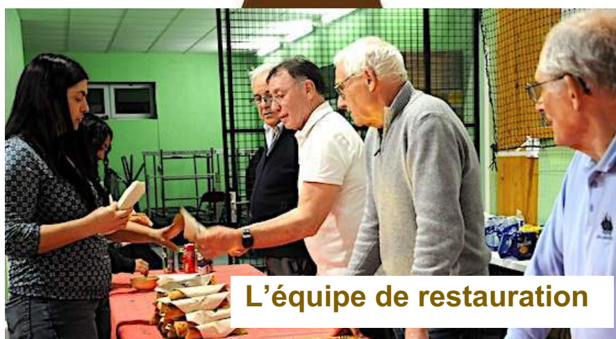
L'équipe de restauration

Bravo à tous les bénévoles pour la préparation, l'organisation et l'état d'esprit ! Patrick C