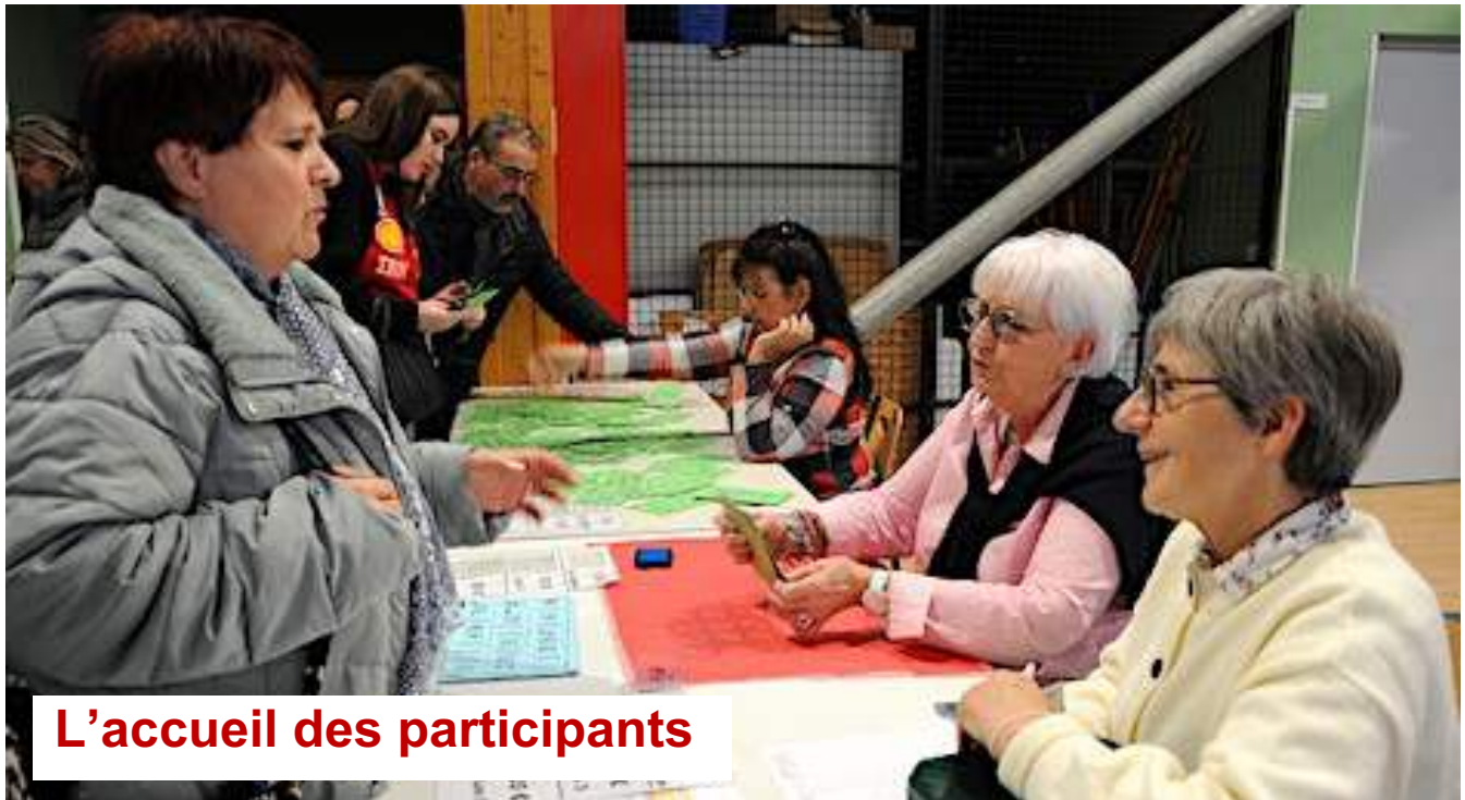
L'accueil des participants